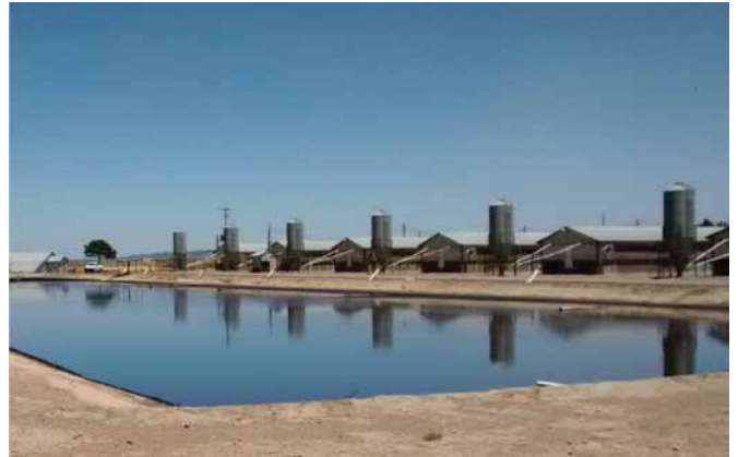
图1. 施加ManureMagic ® 之后的泻湖 (3月)