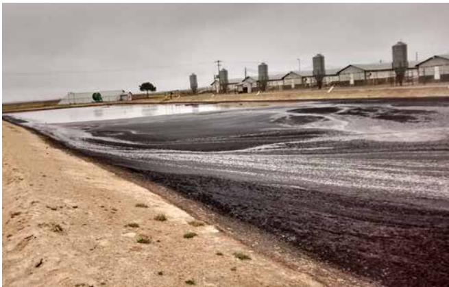
图1. 施加ManureMagic ® 之前的泻湖 (2月)

一场大规模的商业生猪运营遇商遇到了泻湖问题。他们的主泻湖为5个超过10,000头养殖能力的养殖场提供服务，其中含有大量固体物质。它导致了臭气和苍蝇问题。泻湖表面的光泽也招致了一些不请自来的野生动物。一些商业解决方案并没有成功。固体，臭气，苍蝇和光泽都是由滋扰细菌引起的。在泻湖周围和中心的几个点处仅施加了约22.6公斤的ManureMagic ® 一个月后，漂浮的固体几乎消失了，光泽几乎也消失了。